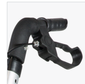
Brake adjustment screw

Over adjustment of the brake will make the brake very difficult to engage. Under adjustment of the brake may cause the brake pad not to engage at all.